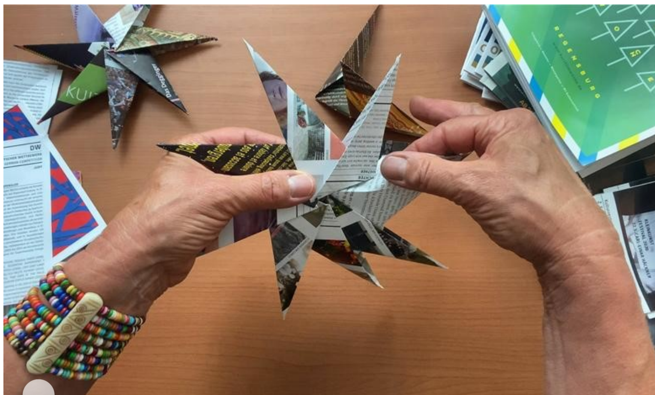
Kultursterne sind ein Zeichen der Solidarität mit den Künstlern.